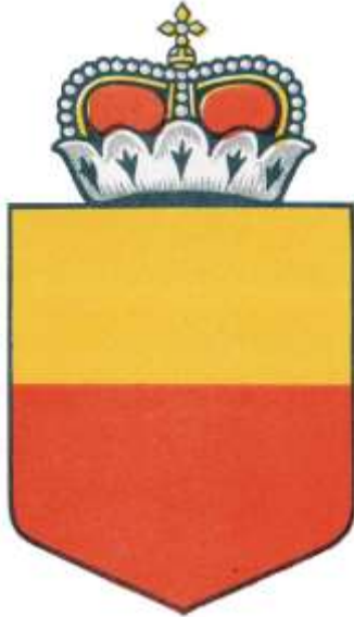
Национальная эмблема Лихтенштейна