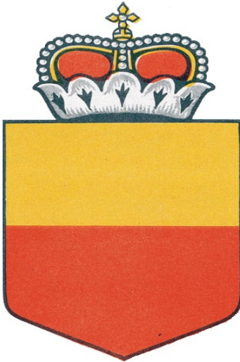
Emblema nacional de Liechtenstein

4. Emblemas nacionales utilizados junto con las marcas de nacionalidad