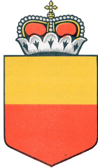
الشعار الوطني لليختنتشتاين