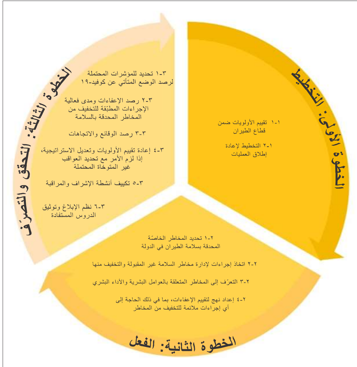
الشكل ١-٥ - دورة التخطيط-الفعل-التحقق-التصرف لإدارة المخاطر المحدقة بسلامة الطيران أثناء تفشي داء كوفيد-١٩

تقتضي عملية اتخاذ القرار تقييم الوضع المتأثري عن جائحة كوفيد-١٩ وجمع وتحليل البيانات والمعلومات المتوفرة ضمن الدولة. وفيما يلي نهج لإدارة مخاطر السلامة باستخدام دورة التخطيط-الفعل-التحقق-التصرف (PDCA) لإدارة المخاطر المحدقة بسلامة الطيران أثناء الجائحة. ويمكن تطبيق مبادئ إدارة السلامة على النحو الوارد وصفه في هذا الفصل من جانب الدول على مستويات مختلفة من تنفيذ برنامج السلامة الوطني.