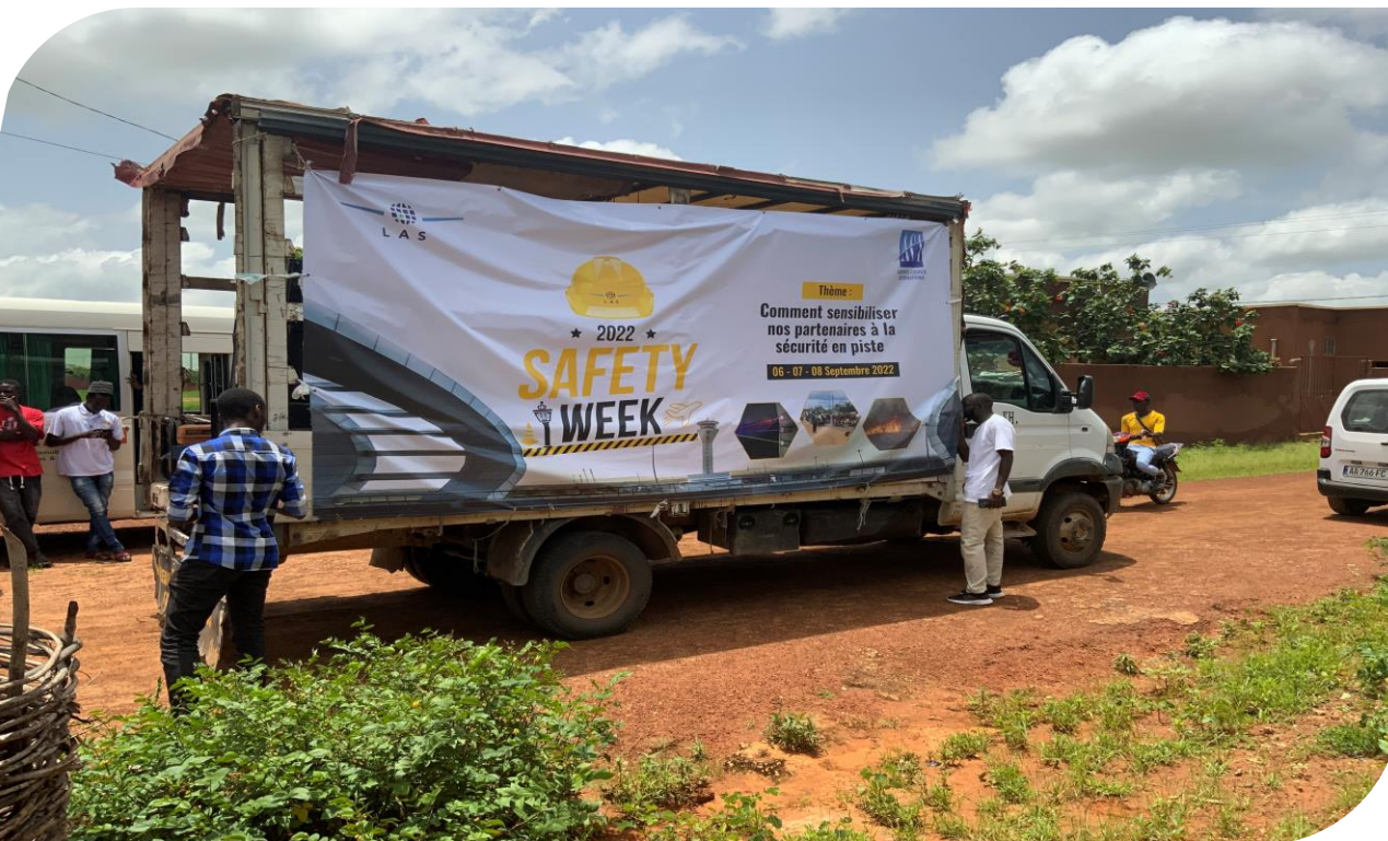
Sensibilisation des riverains sur les dépôts d'ordures et les émissions lasers

Safety week AIBD 2022 : Thème « comment sensibiliser nos partenaires sur la sécurité des pistes ».