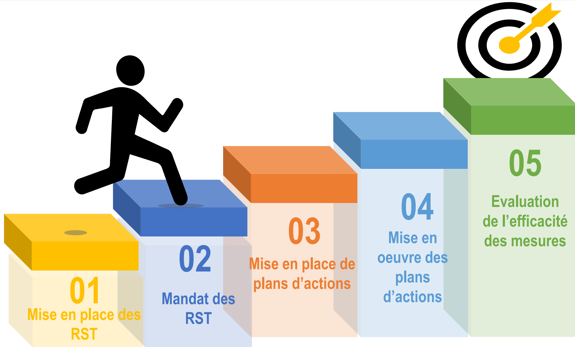
Etapes de mise en œuvre des exigences liées à la RST