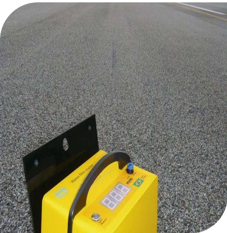
Waterfilmeter pour mesure l'épaisseur d'eau