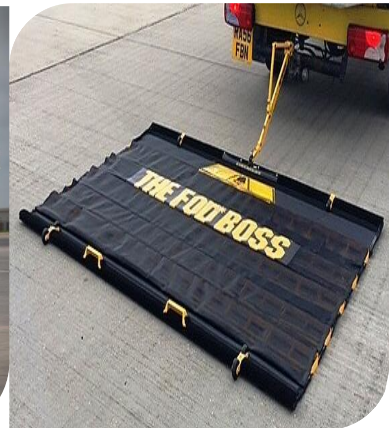
Acquisition de FOD BOSS