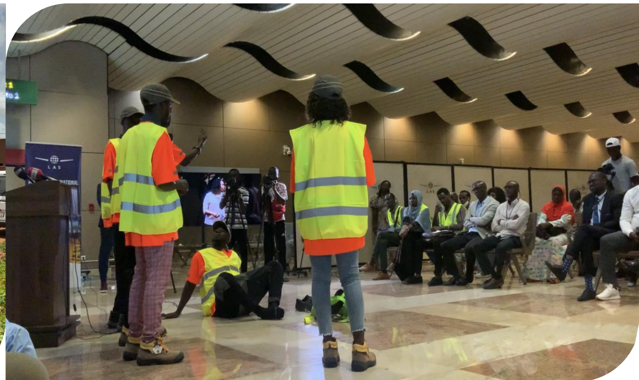
Atelier sur la sécurité des pistes organiser à l'AIBD avec tous les acteurs