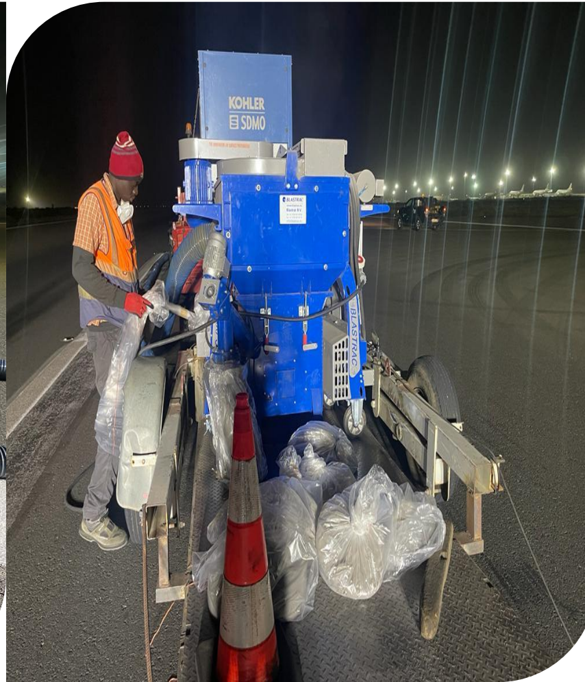
Aspirateur BDC 99 et groupe électrogène