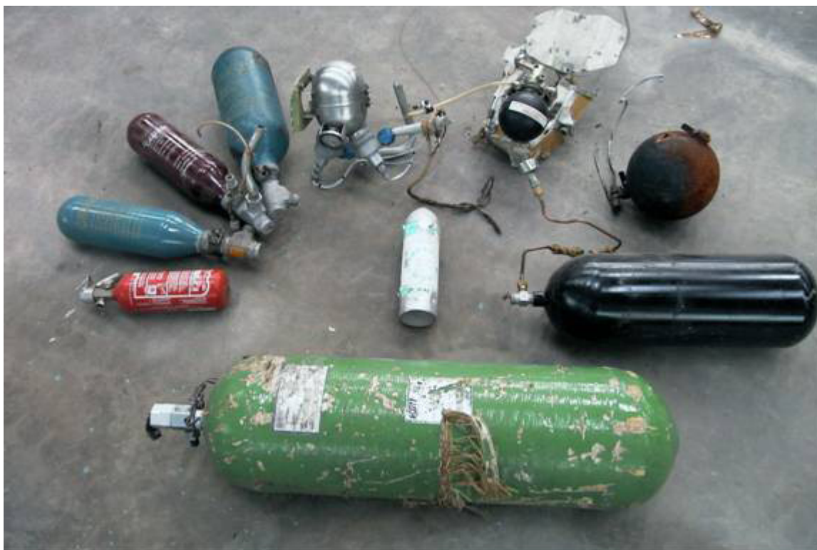
Figure 1. Contenants sous pression récupérés sur des lieux d'accidents d'aviation

3.3.4 Aéronefs militaires et aéronefs démilitarisés. Des modèles d'aéronefs militaires modernes et anciens volent couramment aujourd'hui sous immatriculation civile. Les enquêteurs et les secouristes travaillant sur les lieux d'accidents d'aéronefs civils peuvent donc se trouver en présence de dispositifs d'évacuation de cockpit et de sièges éjectables et, par conséquent, être exposés aux dangers correspondants.