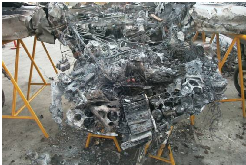
Figure 2. Tableau de bord et avionique endommagés par le feu

3.5.7 Matériaux composites. Les composites à fibres sont aujourd'hui très utilisés en aéronautique ; les structures d'aéronef sont en effet couramment constituées de plus de 15 % en poids de tels matériaux. Une gamme variée de fibres entrent dans la fabrication des composites, notamment le carbone, le verre, le kevlar et le boron, ces dernières et d'autres étant souvent combinées pour donner une fibre hybride. La matrice de résine qui lie les fibres constitue en général environ 40 % du matériau produit. Comme on peut s'y attendre, ces différentes fibres ne se comportent pas de la même façon sous l'action des forces et effets entrant en jeu dans un accident.