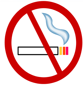
Défense de fumer