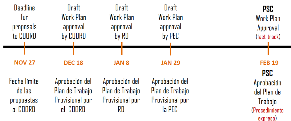
Figure 2 – Suggested 2 nd round for the processing of remaining proposals for the 2021 Project Work Plan.