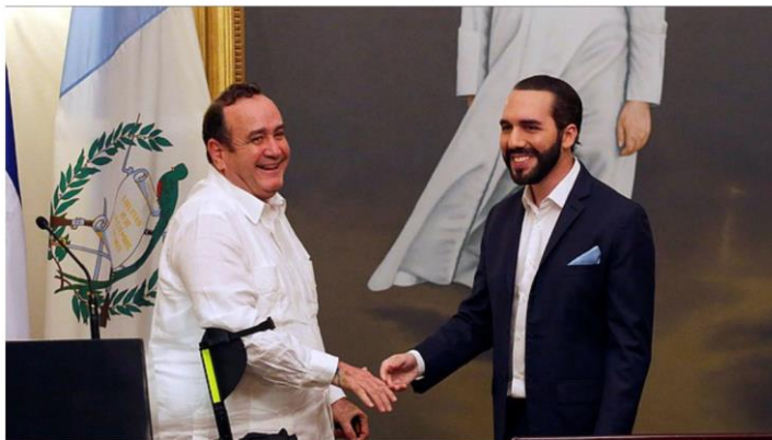
SAN SALVADOR. La propuesta de cielos abiertos data de 1996, pero recién comienza a concretarse en dos países de Centroamérica.

Guatemala plantea a El Salvador tener un puerto con salida al océano Atlántico y permitir el libre tránsito de mercancías