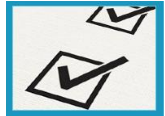
Mudanças no checklist the emergência dos tripulantes