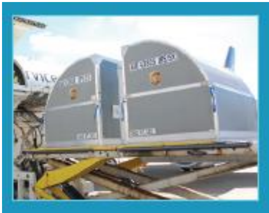
Primeiro container à prova de fogo