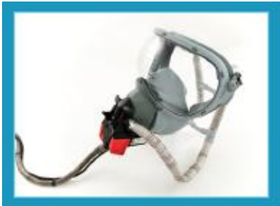
Máscara de oxigênio para todo rosto e para jumpseaters (747-400)