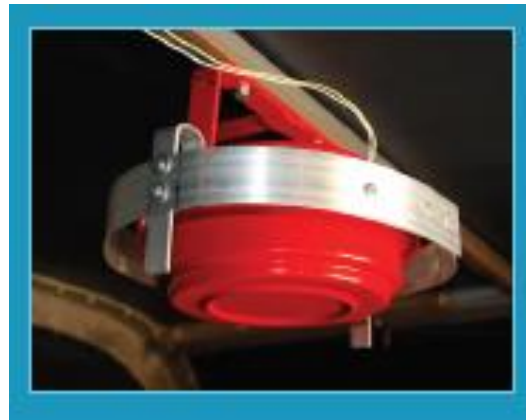
Pó supressor de fogo