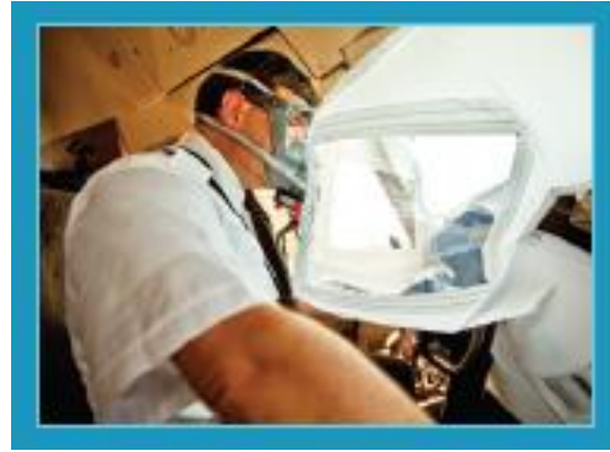
Sistema de garantia de visão de emergência.