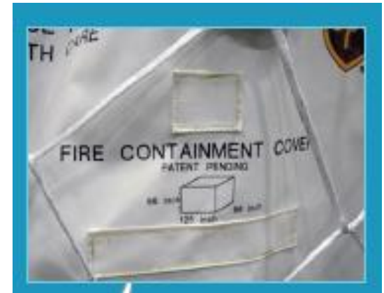
Capa para containers à prova de fogo