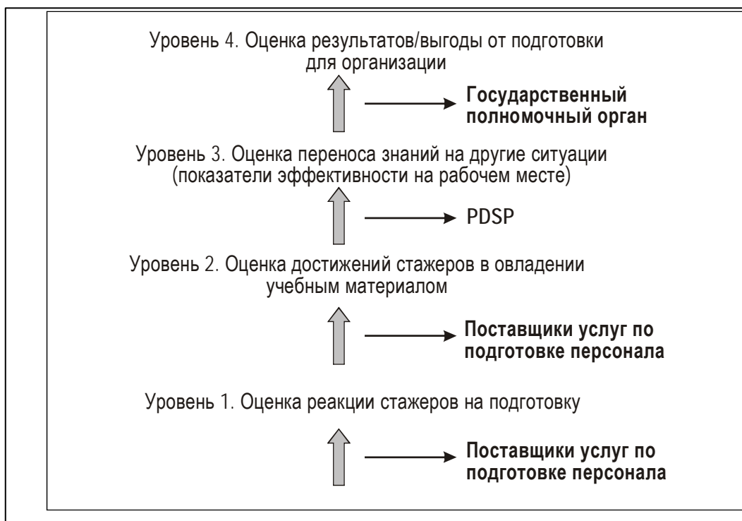
Рис. 5-1. Описание четырех уровней оценки

В целях проведения надлежащей оценки того, какую выгоду от подготовки проектировщиков схем полетов получают поставщики PDSP, государственные полномочные органы и поставщики услуг по подготовке персонала, используется четырехуровневая модель оценки (модель оценки Киркпатрика). Указанная модель учитывает реакцию стажера, овладение учебным материалом, показатель эффективности на рабочем месте и выгоды для организации. Каждый уровень оценивается в порядке следования, обеспечивая важную обратную связь по конкретным аспектам, связывающим подготовку с результатами на рабочем месте. Проведение оценок на уровнях 1 и 2 обеспечивают незамедлительную обратную связь по вопросам структуры, разработки и проведения всех курсов. Уровень 3 обеспечивает поставщикам услуг по подготовке персонала критически важную обратную информацию о показателях эффективности стажеров на рабочем месте, которые успешно прошли утвержденный курс подготовки. Уровень 4 является самым верхним уровнем оценки; он требует прямой линии связи между всеми сторонами, задействованными в процессе подготовки проектировщиков схем полетов. На рис. 5-1 приводится описание указанных 4 уровней оценки.