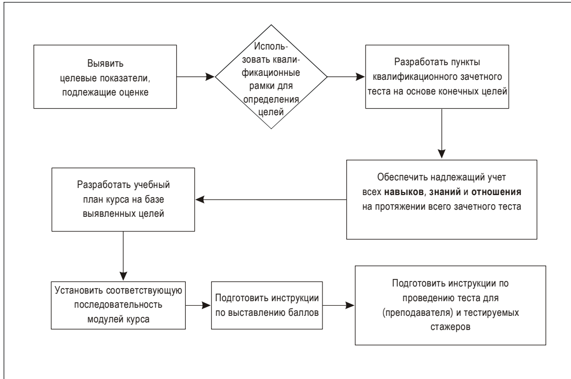
Рис. 3-1. Процесс разработки зачетного теста

3.6.5.3 Текущие тесты следует разрабатывать для проверки конкретных навыков, знаний и отношения (SKA), необходимых для поддержки вспомогательных целей. SKA можно оценивать следующим образом: