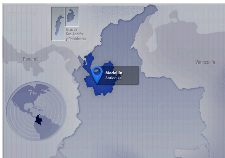
Рис 1.

Город Медельин находится в департаменте Антьокия и является основным ядром столичного региона долины Абурра (Андский регион). Он расположен в 450 км —в часе лета—от столицы, Богота.