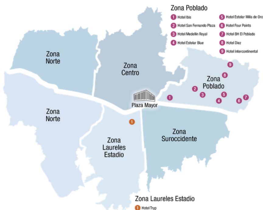
Рис 2. Гостиницы, выбранные для обслуживания Ассамблеи

Для получения более подробной информации пройдите по следующей ссылке: http://eventos.aviatur.com.co/hoteles/