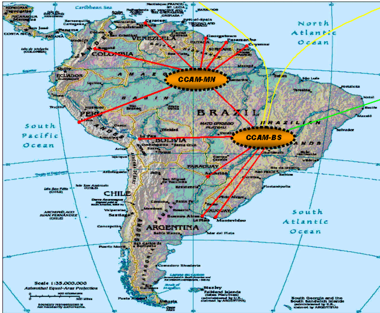
Figura 2: Conexiones AFTN Internacionales Actuales de Brasil