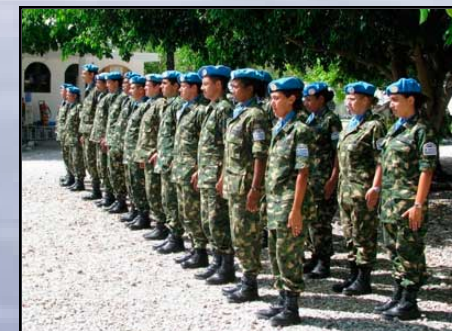
MISIONES DE PAZ