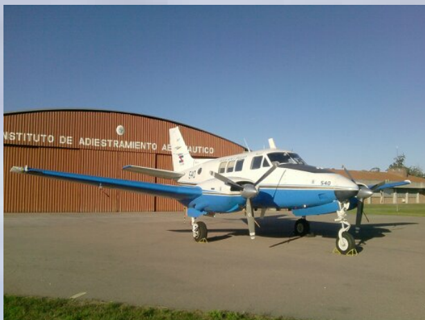
U-8F FAU 540