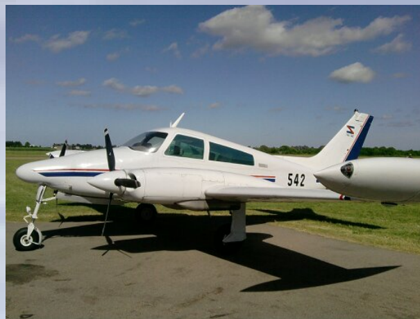
C-310 FAU 542