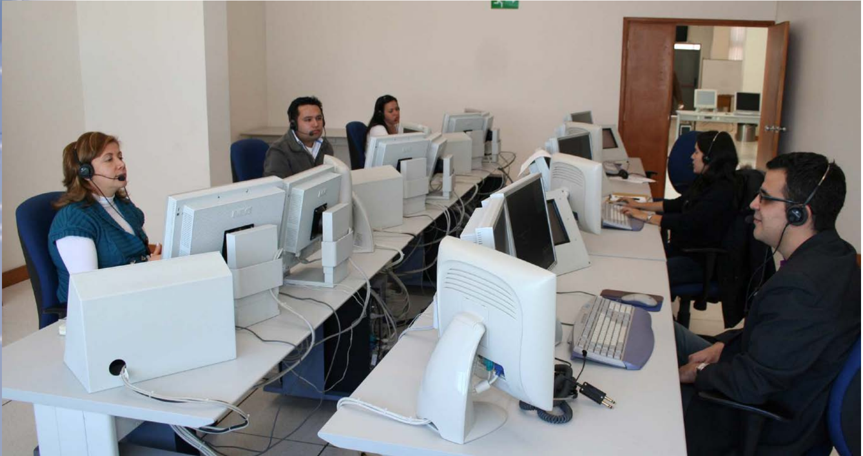
SALA DE PSEUDOPILOTOS