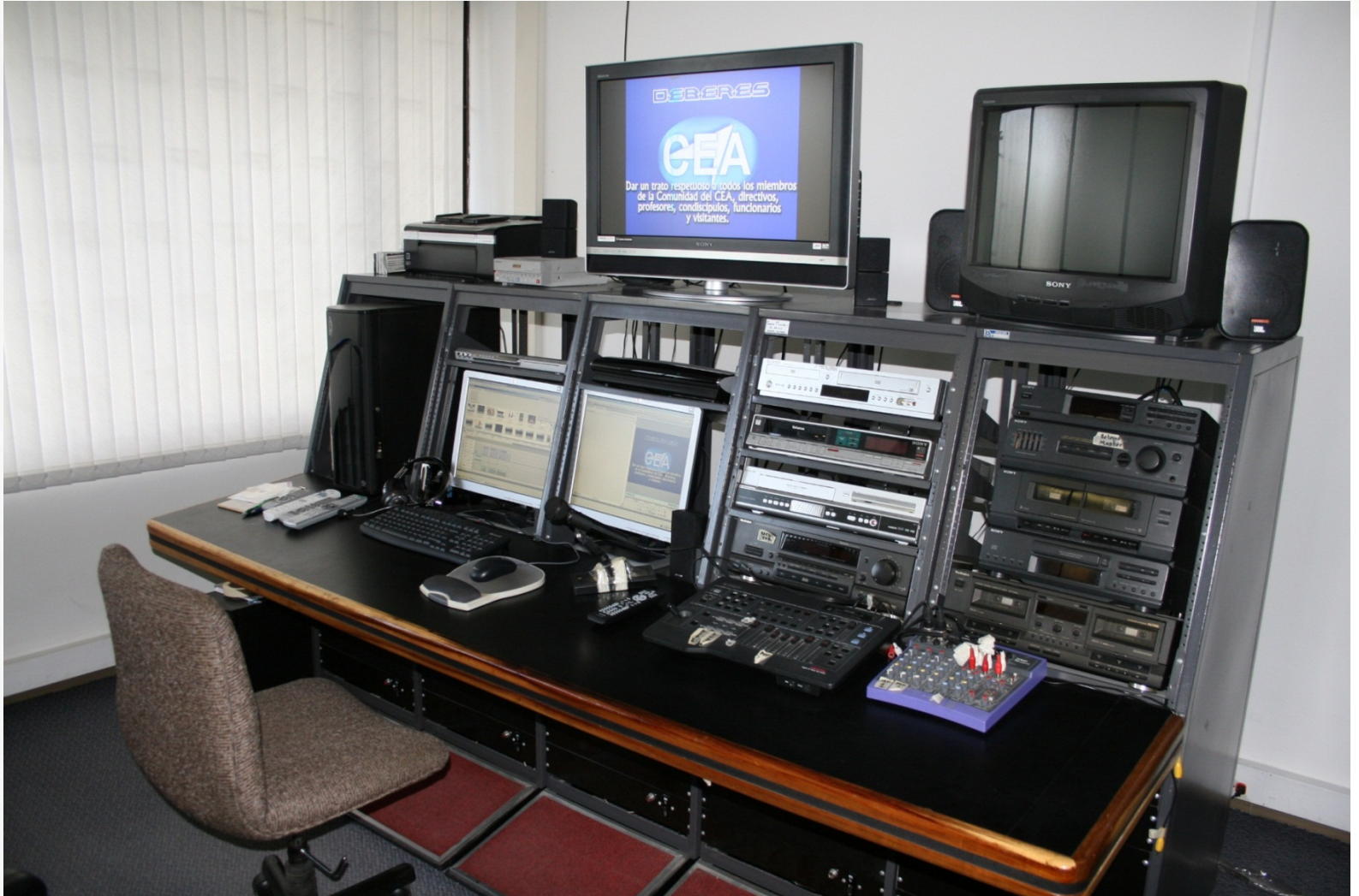
LABORATORIO DE AUDIOVISUALES