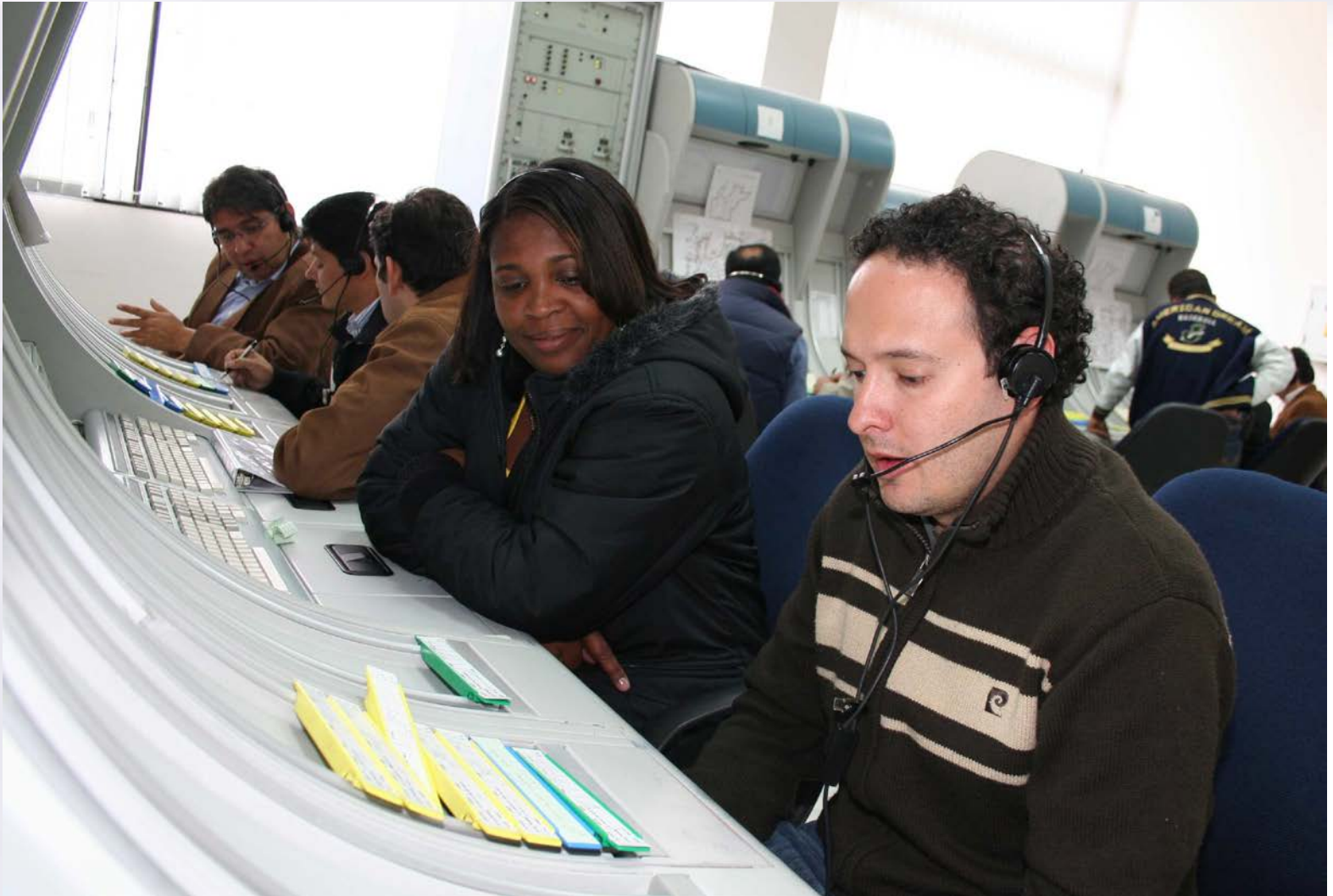
SIMULADOR NO RADAR