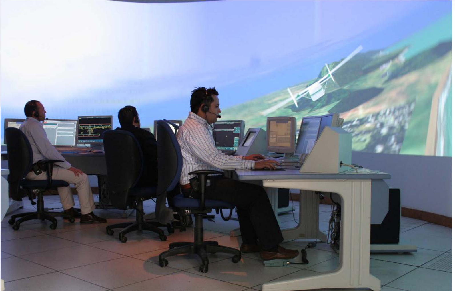
SIMULADOR VIRTUAL DE AERODOMO