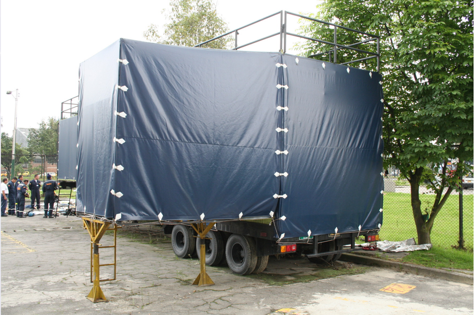
SIMULADOR MOVIL DE ESPACIOS CONFINADOS