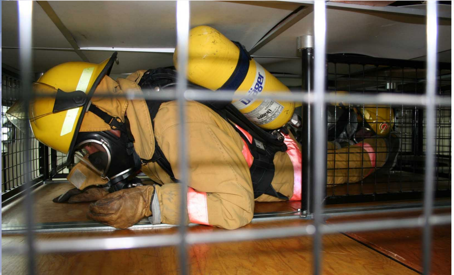
SIMULADOR DE ESPACIOS CONFINADOS