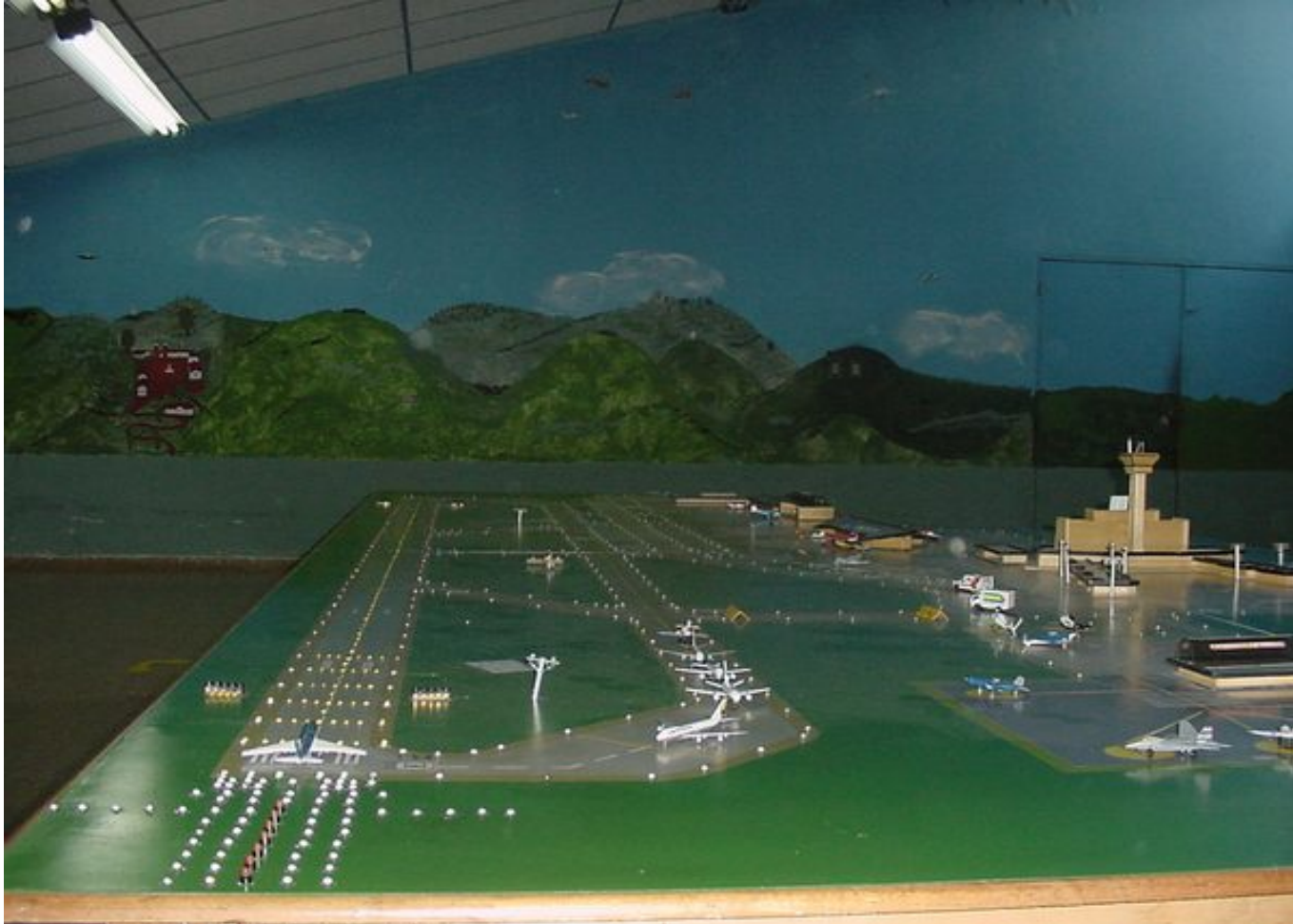
SIMULADOR CONVENCIONAL DE AERODROMO