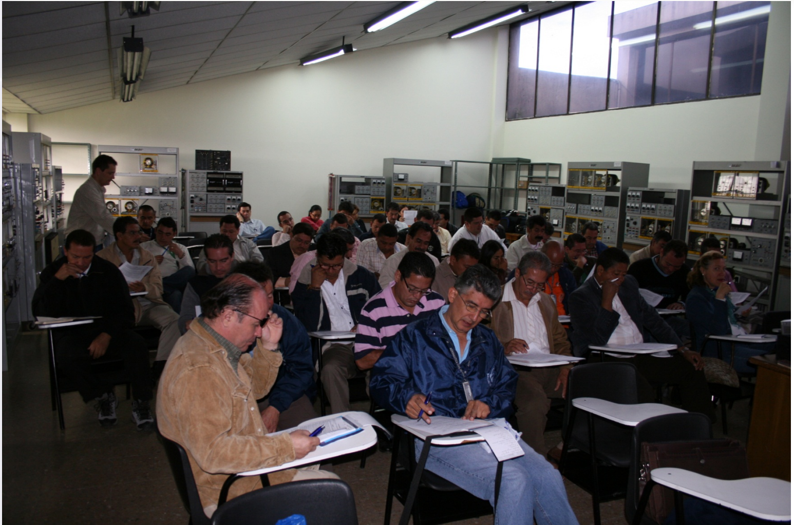
LABORATORIO DE MOTORES Y ELECTRICIDAD