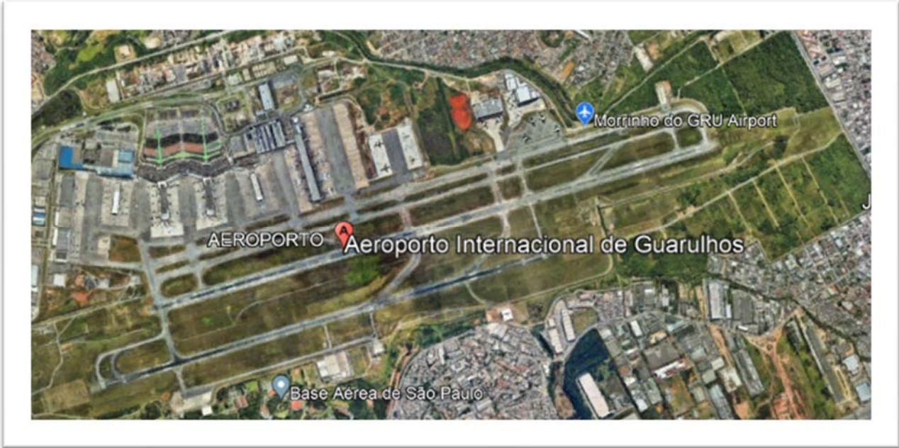
Figura 1 – Aeropuerto Guarulhos - SP

4.3 Este proyecto comenzó en 2023 y el aeropuerto elegido para ser el primero en recibir aproximación A-RNP fue el aeropuerto Guarulhos (GRU). La decisión ha sido para ese aeropuerto porque es el mayor desafío a superar, en términos de obstáculos, y el que traerá más beneficios para las aerolíneas que operan en GRU.