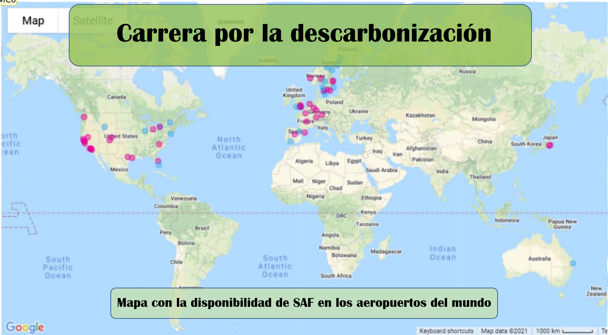
Mapa con la disponibilidad de SAF en los aeropuertos del mundo