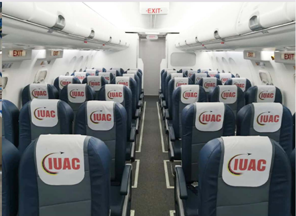
SIMULADOR TRIPULANTE DE CABINA DE PASAJEROS