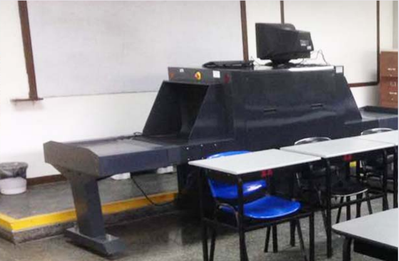
LABORATORIO DE AVESC