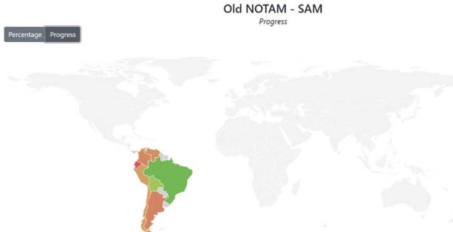
Figure 2: Progress of OLD NOTAM in the SAM Region