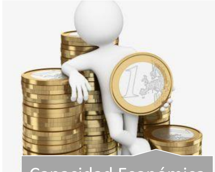
Capacidad Económica – Financiera