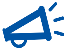
Plan de Comunicaciones