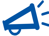
Plan de Comunicaciones