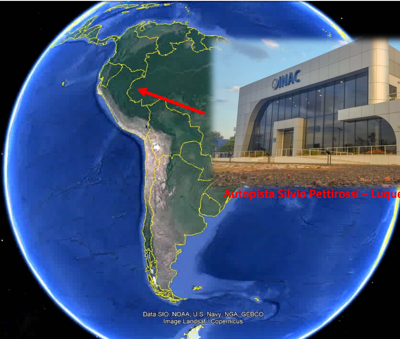
Autopista Silvio Pettrossi – Luque (Paraguay)

Data SIO, NOAA, U.S. Navy, NGA, GEBCO Image Landsat / Copernicus