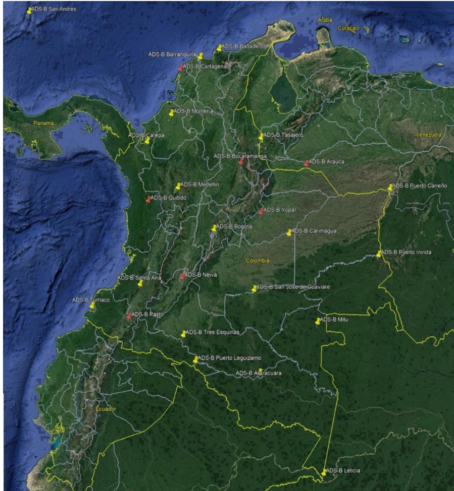
Figura 2 – Estaciones ADS-B de Colombia

2.7 Colombia ha desarrollado un extenso Proyecto de implantación ADS-B, con miras a proveer servicio a partir de enero de 2010. La Figura 2 presenta a localización de las 26 estaciones ADS-B implantadas.