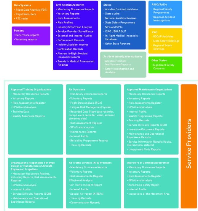
Figure 13. Typical safety data and safety information resources