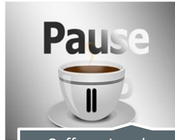
Coffee y Lunch Breaks