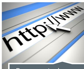
Documentación en Web