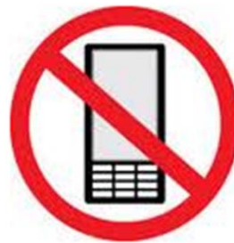
No hablar por teléfono