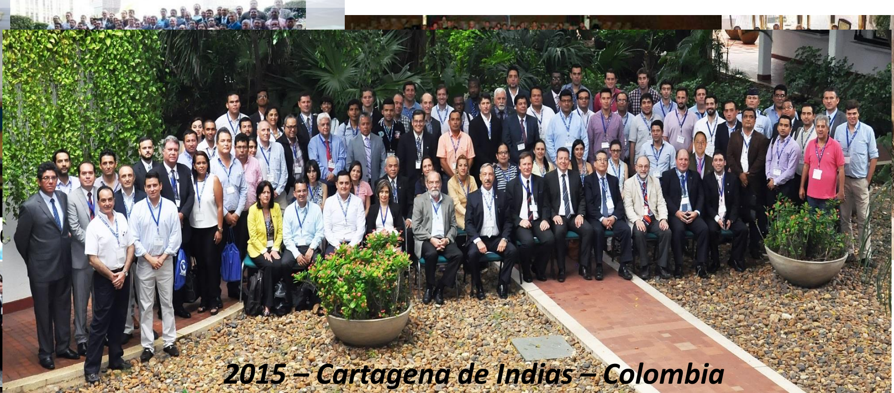
2015 – Cartagena de Indias – Colombia