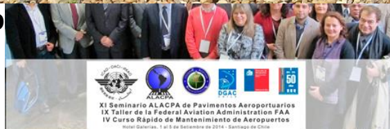
2014, Santiago de Chile