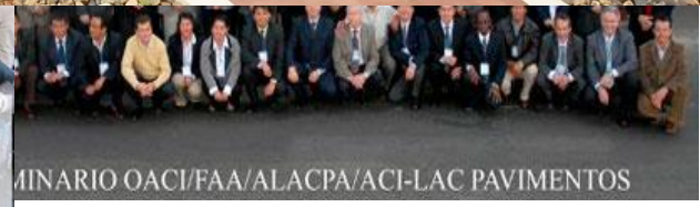
2007 Perú, Lima