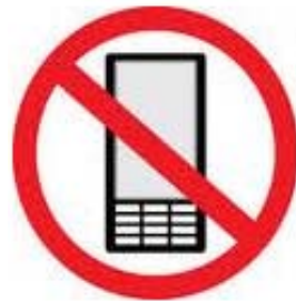
No hablar por teléfono