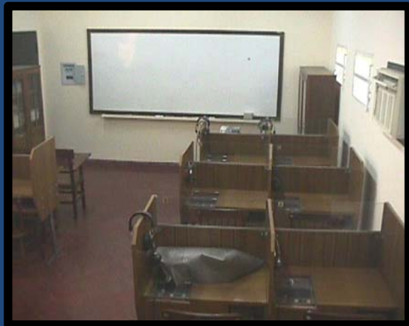
Laboratorio de Inglés