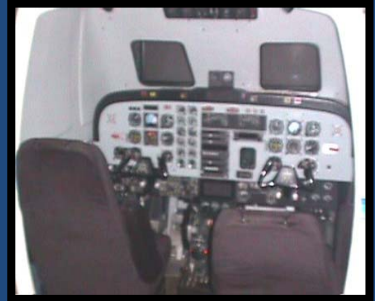
FRASCA B- 1900 Turbo Hélice – Bimotor.