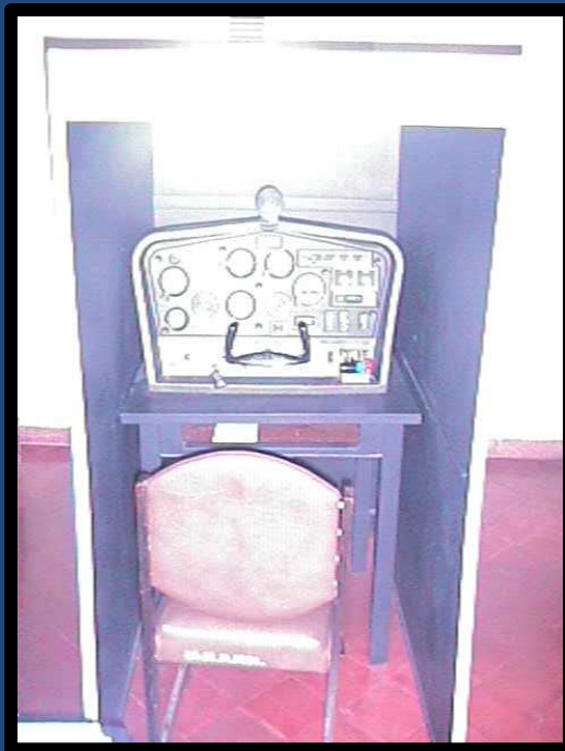
ATC 610 y 810, mono y bimotor respectivamente