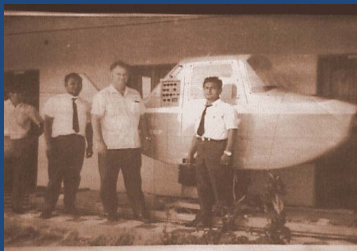
Simulador Modelo GAT 1 - Monomotor