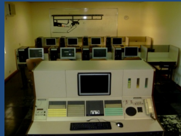
SRBC - SICAD