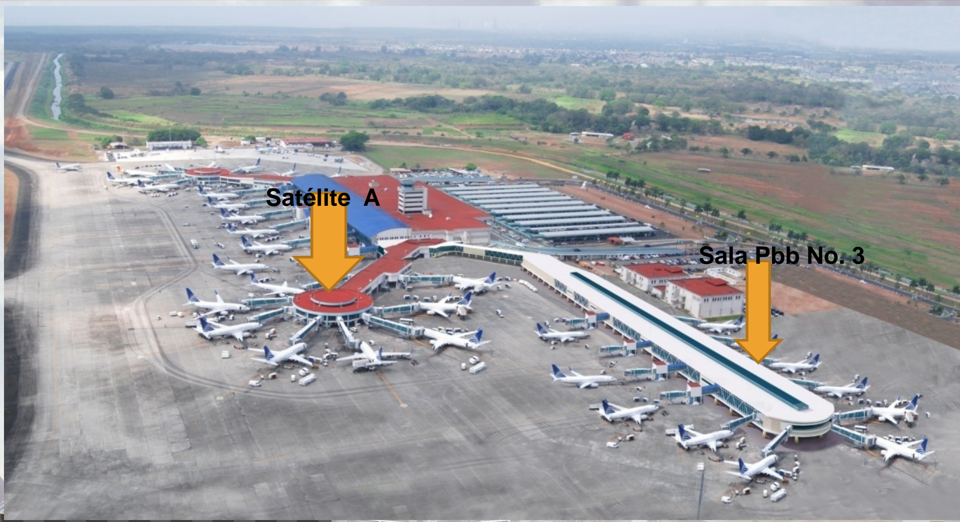
Satélite A y Sala No. 3 Muelle Norte