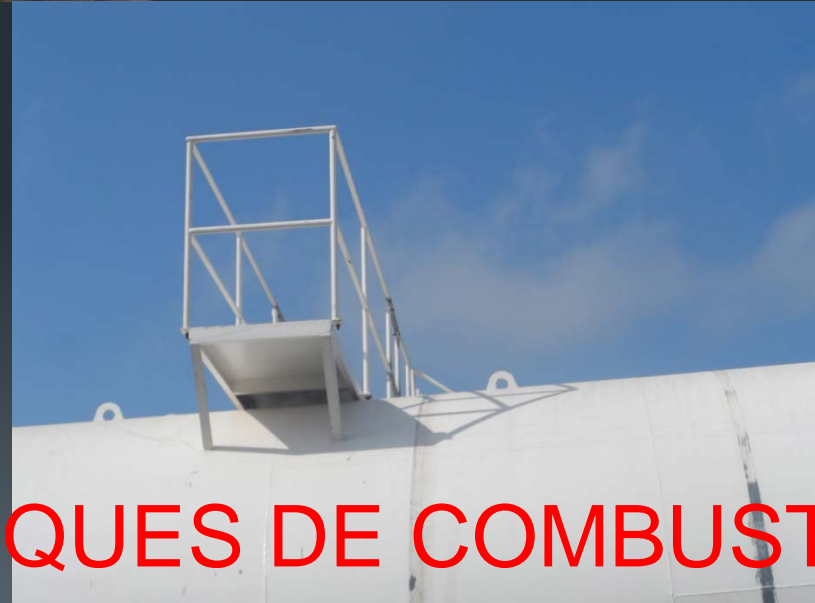
TANQUES DE COMBUSTI