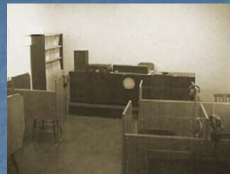
Laboratorio de INGLES