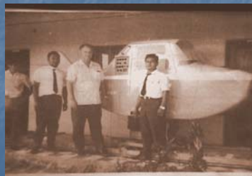
Simulador Modelo GAT 1 - Monomotor