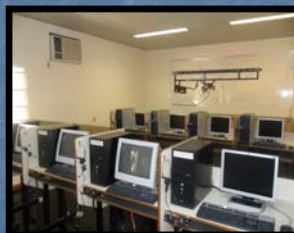
Laboratorio SRBC y SICAD ATC