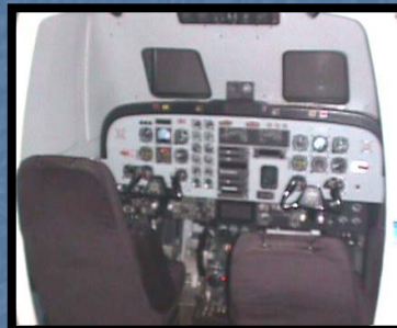
FRASCA B- 1900 Turbo Hélice – Bimotor.