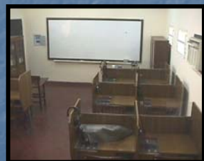
Laboratorio de Inglés