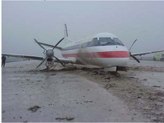
Aterrizaje demasiado largo de un Saab 340, en JFK, Mayo de 1999