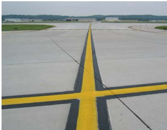
Marcas anteriores en el eje de la calle de rodaje