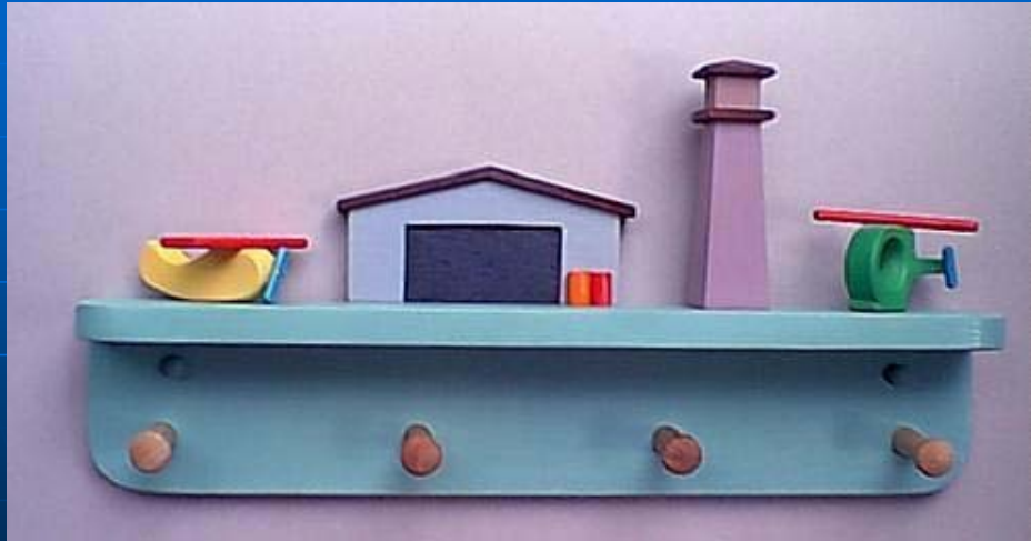
“La Aviación No Es Un Juego”