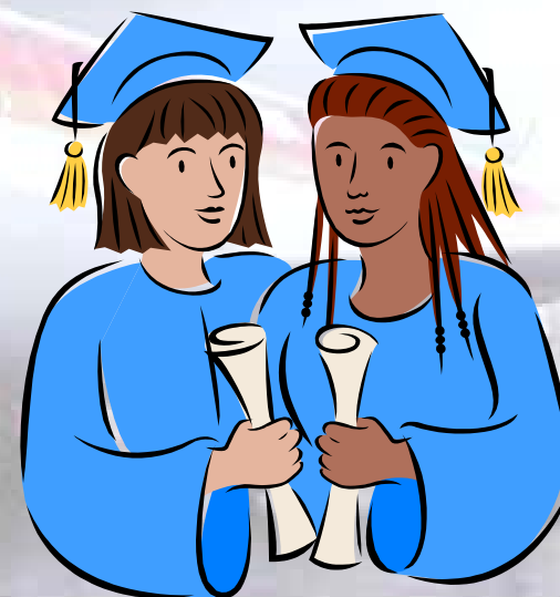
Diplomadas en RVSM