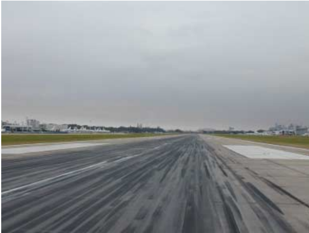
Contaminación de caucho en zona de toma de contacto de cabecera 13 (julio de 2002)