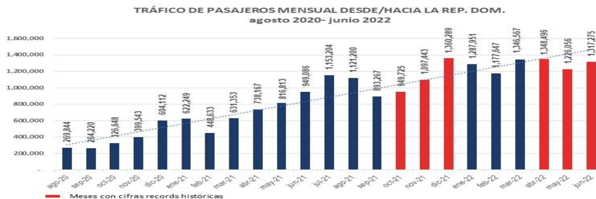
出入多米尼加共和国的月度旅客流量 2020 年 8 月—2022 年 6 月

2.3.2 2022 年预计将有 1 500 万出入境旅客，与 2019 年相比，航空服务将 100%恢复。