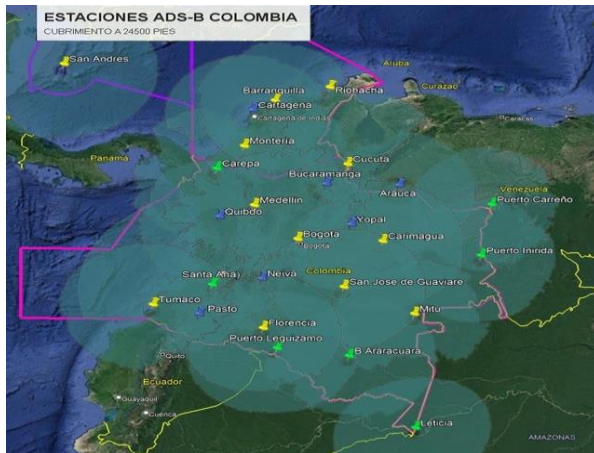
Figura 1. Mapa Estaciones ADS-B Colombia