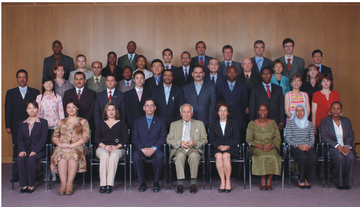
Curso de familiarización de la OACI celebrado en Montreal del 13 al 28 de julio