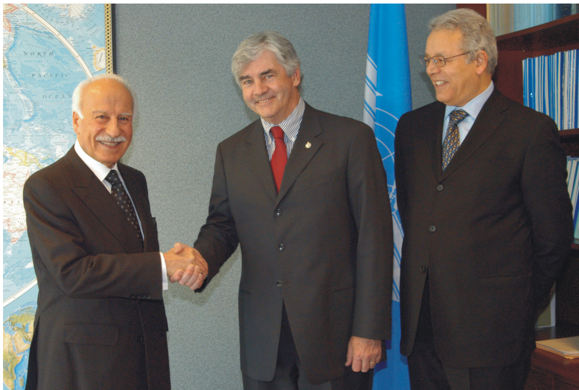
Inauguración de la Conferencia de Directores Generales de Aviación Civil (DGCA/06) celebrada en Montreal del 20 al 22 de marzo