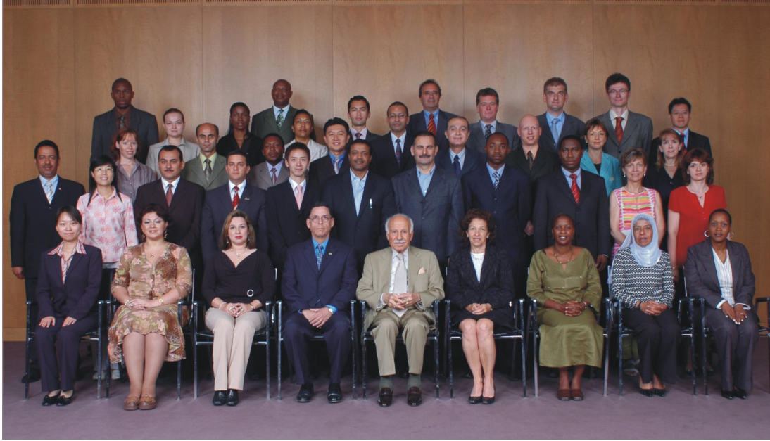
دورة التعريف بالايكاو المعقودة في مونتريال من ١٣ الى ٢٨ يوليو