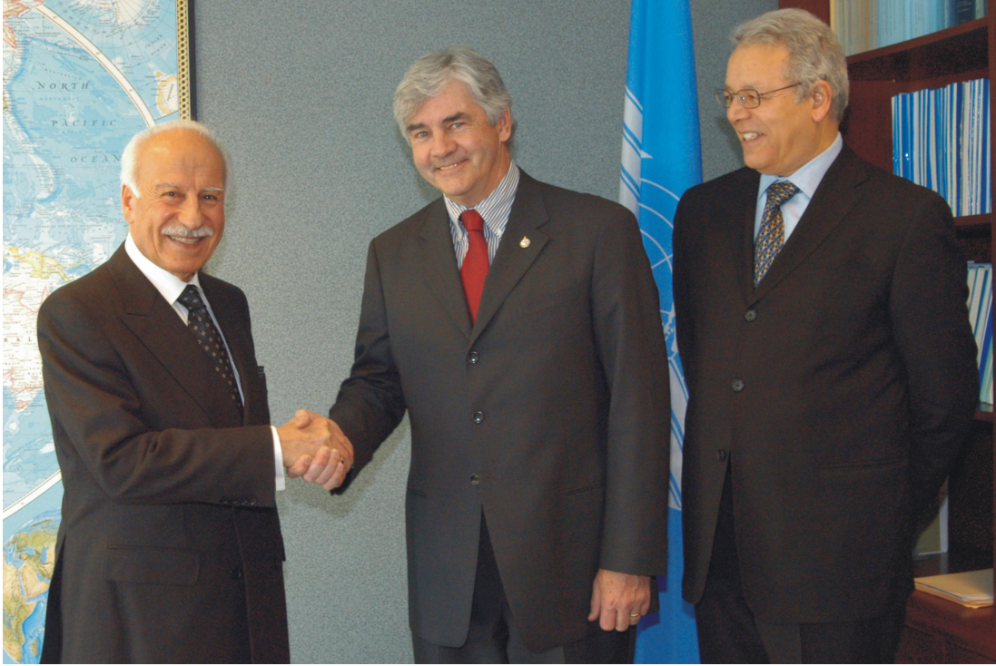
افتتاح مؤتمر رؤساء الطيران المدني المنعقد في مونتريال من ٢٠ الى ٢٢ مارس