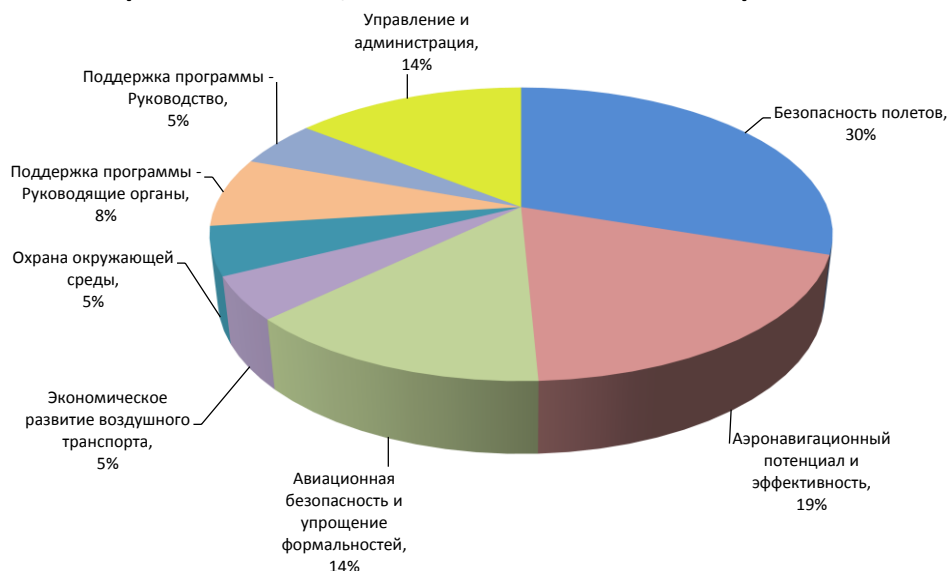
Рис. 1. Бюджетная смета на 2020–2022 гг. с разбивкой по стратегическим целям и вспомогательным стратегиям

44. В соответствии с финансовым положением 4.4 сметы бюджета Регулярной программы должны включать ассигнования на программу, поддержку программы и управление и администрацию. В то время как программа охватывает ресурсы на стратегические цели, поддержка программы и управление и администрация относятся к вспомогательным стратегиям.