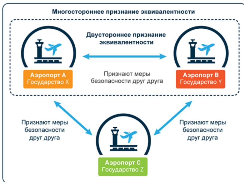
Рисунок 3 иллюстрирует многостороннее и двустороннее признание эквивалентности. О любых договоренностях по признанию эквивалентности должно быть сообщено государствам, которых они затрагивают, и заинтересованным сторонам авиационной отрасли. Образец официального соглашения о признании эквивалентности мер авиационной безопасности представлен в добавлении.