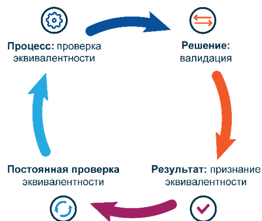
Рис. 1. Процесс признания эквивалентности

Как описано ниже и показано на рис. 1 , необходимо отличать процесс, ведущий к признанию эквивалентности, от результата этого процесса, т. е. самого признания. Процесс верификации охватывает все участвующие государства, в то время как окончательное решение о признании эквивалентности может быть принято только одним государством (одностороннее признание), либо на взаимной основе (двустороннее/многостороннее признание). Процесс признания эквивалентности осуществляется на уровне государств.