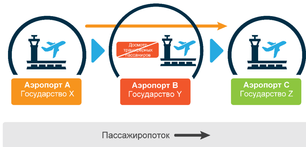
Рис. 2. Реализация договоренностей о признании эквивалентности

Процесс верификации имеет целью подтвердить, что меры безопасности в государстве по крайней мере эквивалентны, с точки зрения конечного обеспечения безопасности, мерам, предпринимаемым другим государством. На рис. 2 показано, какой может быть реализация договоренности о признании эквивалентности между государством X (или аэропортом A) и государством Y (или аэропортом B).