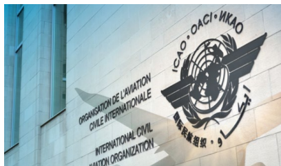
Aviation's Global Position (Posición global de la aviación)