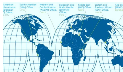
State Positions (Posición de los Estados)