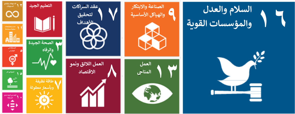
الشكل ٣: أهداف التنمية المستدامة