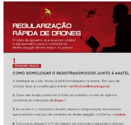
Рисунок 5: Ускоренный режим в связи с желтой лихорадкой

2.6 Кроме этого, принимая во внимание Олимпийские и Паралимпийские игры 2016 года в Рио-де-Жанейро, Секретариат подготовил "Справочник по надзору за полетами беспилотных воздушных судов" (рисунок 6), в котором действия по обеспечению соблюдения требований подкрепляются необходимой документацией, зонами ограничения воздушного пространства (рисунок 7) и правовыми рамками, если они не отвечают действующим правилам.