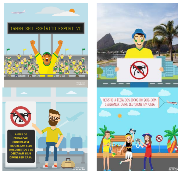
Рисунок 8. Видеоматериалы для Олимпийских игр

2.8 Для Олимпийских и Паралимпийских игр 2016 года были подготовлены четыре видеоматериала (рисунок 8), в которых людям рекомендовалось оставлять БАС дома и наслаждаться спортивными мероприятиями, а также рассказывалось о штрафах за ненадлежащее использование оборудования в период Олимпийских игр.