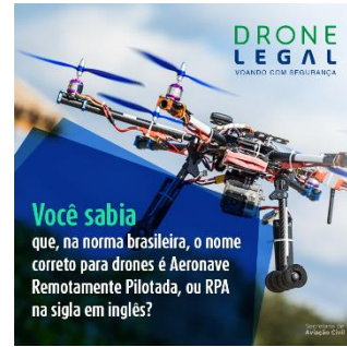
Рисунок 3. Картинка "Легальный дрон"

2.4 В феврале 2016 года на сайте http://www.aviacao.gov.br/assuntos/drone-legal Секретариат опубликовал страницу "Легальный дрон" (рисунок 4), на которой была размещена информация регламентирующих органов и объяснялись различия между способами использования оборудования и правовые требования к нему, такие как рекреационное и нерекреационное использование, действующие правила и прочее.