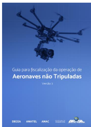
Рисунок 6. Справочник по надзору за производством полетов беспилотных воздушных судов