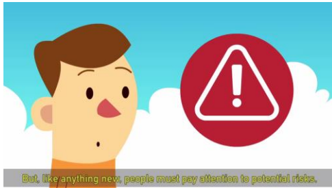
Рисунок 2. Начальный видеокадр кампании