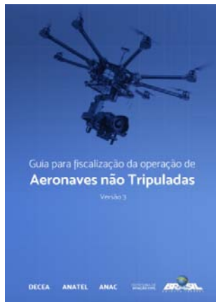
Figura 6: Guia para la vigilancia de la operación de aeronaves no tripuladas