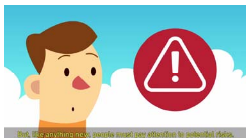
Figura 2: Imagen del video de lanzamiento de la campaña