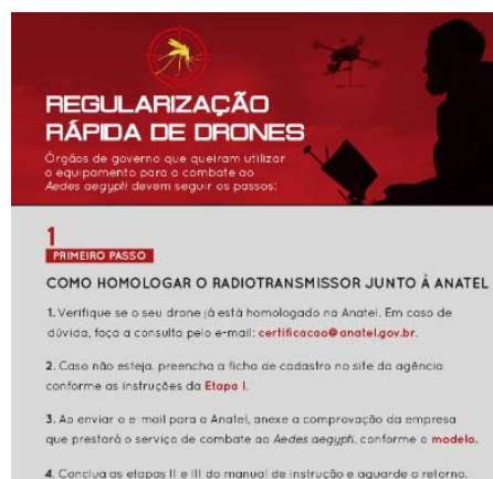
Figura 5: Procedimiento acelerado asociado al Aedes aegypti

2.6 Con una atención especial puesta en los Juegos Olímpicos y Paralímpicos Rio 2016, se ha elaborado la Guía para la vigilancia de la operación de aeronaves no tripuladas (figura 6), que apoya las medidas para el cumplimiento de la normativa, proporciona la documentación necesaria, informa del espacio aéreo sometido a restricciones (figura 7) y del marco jurídico existente a fin de prevenir el incumplimiento de la reglamentación vigente.