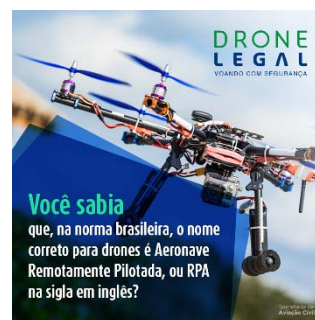
Figura 3: Cartel Drone Legal

2.4 En febrero de 2016 la Secretaría publicó la página web Drone Legal en http://www.aviacao.gov.br/assuntos/drone-legal (figura 4), donde se concentra la información de los organismos de reglamentación y se explica las diferencias entre las diversas formas de utilización del equipo y sus requisitos legales, tales como los relativos al uso recreacional y no recreacional, la reglamentación existente, etc.