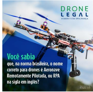
الرسم رقم ٣: بطاقات بعنوان Drone Legal استخدام طائرة بلا طيار على نحو نظامي