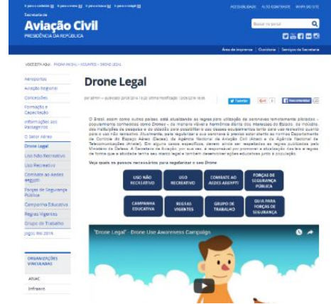
الرسم رقم ٤: صفحة Drone Legal

٦-٢ واثاء الاستعدادات لتنظيم الألعاب الأولمبية والألعاب الأولمبية للمعوقين في ريو لعام ٢٠١٦، أصدرت السلطات دليلاً بعنوان "دليل مراقبة عمليات الطائرات غير المأهولة" (الرسم رقم ٦) يتضمن تدابير الإنفاذ المستندة الى ما يلزم من الوثائق مع تحديد المجالات الجوية المقيدة (الرسم رقم ٧) والأطر القانونية في حالة عدم الامتثال للتنظيمات السارية.