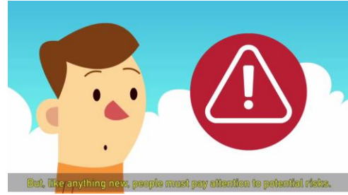
الرسم رقم ٢ : حملة من خلال شريط الفيديو

٤-٢ وفي شهر فبراير ٢٠١٦، أصدرت الأمانة صفحة بعنوان Drone Legal على الموقع التالي: http://www.aviacao.gov.br/assuntos/drone-legal (الرسم رقم ٤) مع تركيز المعلومات عن الهيئات التنظيمية وشرح الاختلافات بين سبل استخدام التجهيزات والشروط القانونية المرتبطة بها، مثل الاستخدام الترفيهي وغير الترفيهي والقواعد السارية وإلى آخره.