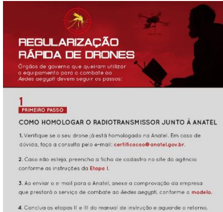
الرسم رقم ٥: التسريع في اعتماد الأساليب لمكافحة البعوض المصري

٥-٢ وبسبب تفشي وباء فيروس البعوض المصري (Aedes aegypti) في البرازيل، تم استخدام أساليب مكافحة الانتاج السريعة (الرسم رقم ٥) بهدف المساعدة على تسهيل عملية الموافقة لكي تستخدم الوكالات الحكومية نظم UAS في آليات مكافحة البعوض المصري، مما أدى إلى تقليص الفترة المتوسطة لقيام الهيئات التنظيمية بالموافقة على استخدام هذه الطريقة من السنتين يوماً إلى تسعة أيام.