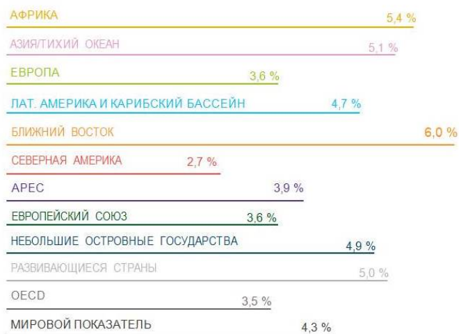
Рис.1. Прогнозируемые ежегодные темпы прироста объема международных перевозок по регионам, 2014–2034 гг.